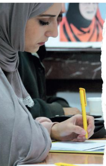
Maraton Pisania Listów Amnesty International w Algierii.