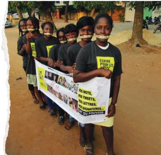
Aktywistki Maratonu w Togo.

Prawa człowieka nie są luksusem, który można realizować tylko wtedy, gdy pozwalają na to okoliczności faktyczne.