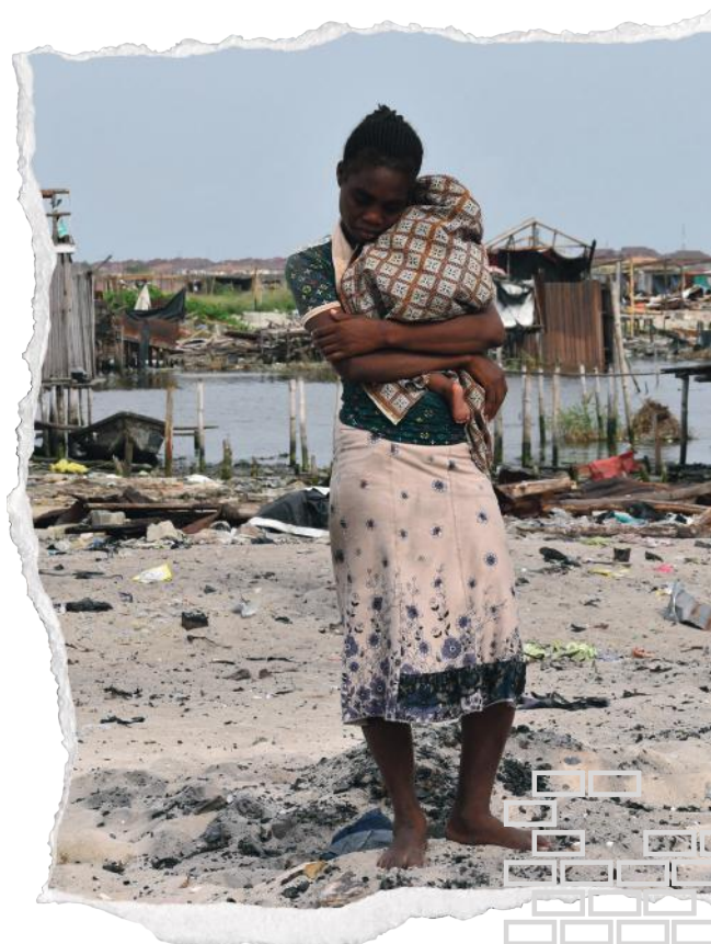
Po eksmisji w Otodo Gbambe