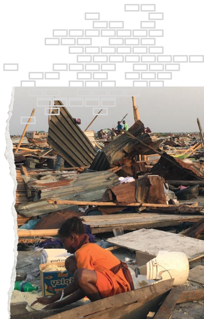
Po eksmisji w Otodo Gbambe