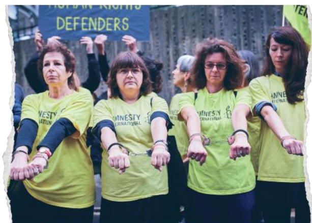
Członkinie Amnesty International protestujące pod ambasadą Turcji w Paryżu, lipiec 2017

Nasza praca chroni i wzmacnia ludzi - od zniesienia kary śmierci, do propagowania praw reprodukcyjnych i seksualnych, od zwalczania dyskryminacji do bronięcia praw uchodźców i uchodźczyń oraz migrantów i migrantek. Pomagamy doprowadzić sprawców tortur przed oblicze sprawiedliwości i zmieniać opresyjne prawa. A przede wszystkim uwalniać ludzi więzionych za wygłaszanie własnych opinii. Jesteśmy głosem uciskanych i pozbawianych swobód i godności.