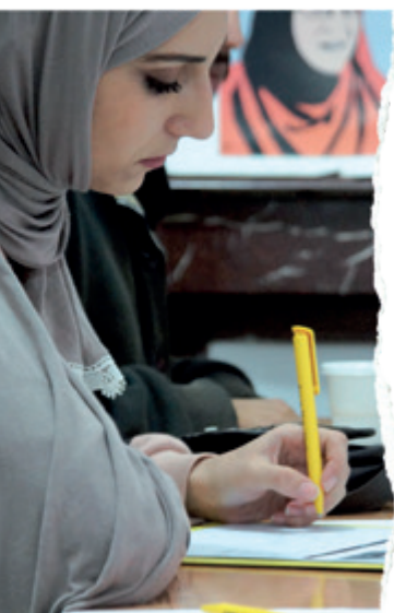
Pisanie listów podczas Maratonu w Algierii.