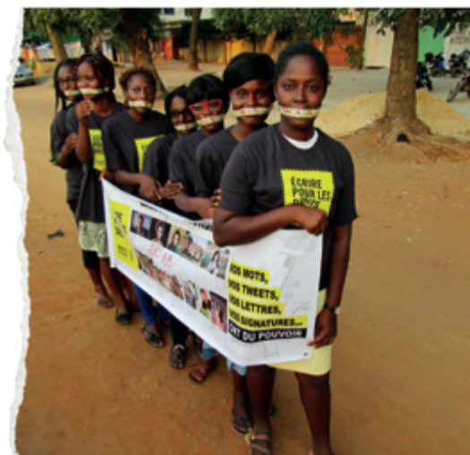
Aktywistki Maratonu w Togo.

Prawa człowieka nie są luksusem, który można realizować tylko wtedy, gdy pozwalają na to okoliczności.