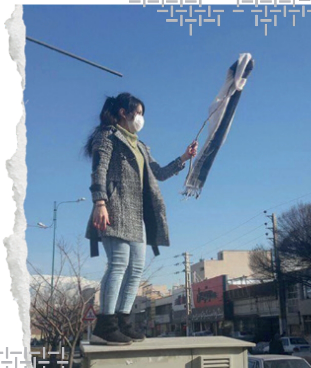
Kobieta protestująca przeciwko noszeniu hidżabu stoi na dachu w mieście Karaj, Prowincja Alborz i nakłada swoją chustę na kij, w pokojowym proteście przeciwko nakazowi zasłaniania głowy.

Prawo Irańskie dotyczące obowiązkowego zasłaniania głowy jest oczywistym naruszeniem praw kobiet i dziewcząt. Przez zmuszanie ich do zasłaniania włosów także przy użyciu siły i upokorzeń, aresztowań i więzienia, władze naruszają także godność kobiet i dopuszczają się okrutnego, nieludzkiego i poniżającego traktowania lub karania, co jest sprzeczne z prawem międzynarodowym. W przypadku, gdy te praktyki wywołują ból lub cierpienie mogą nawet kwalifikować się jako tortury.