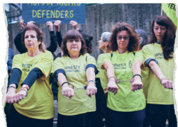
Członkinie i członkowie Amnesty International podczas protestu przed ambasadą Turcji w Paryżu, lipiec 2017 r.

Nasza praca chroni i wzmacnia ludzi - od zniesienia kary śmierci, do propagowania praw reprodukcyjnych i seksualnych, od zwalczania dyskryminacji do bronięcia praw uchodźców i uchodźczyń oraz migrantów i migrantek. Pomagamy doprowadzić sprawców tortur przed oblicze sprawiedliwości i zmieniać opresyjne prawa. A przede wszystkim uwalniamy ludzi więzionych za wygłaszanie własnych opinii. Jesteśmy głosem uciskanych i pozbawianych swobód i godności.